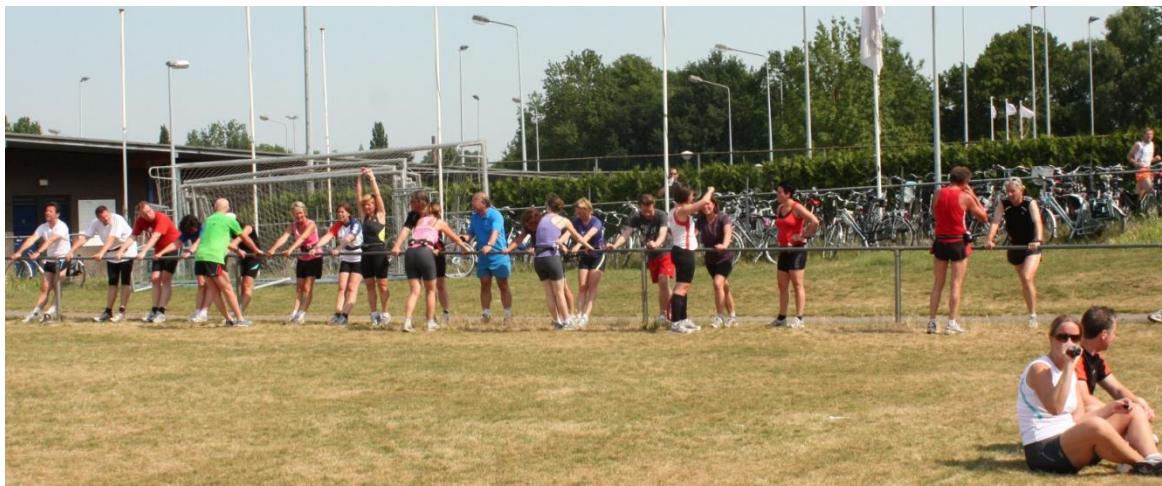
Cooling-down na de training