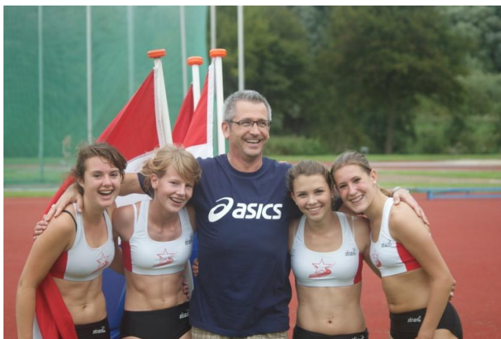
Goud voor junioren meisjes C bijde NK Estafette, september 2010

Er zit veel talent bij onze baanatleten. Dat laten de podiumplaatsen bij regionale en landelijke wedstrijden wel zien. In totaal waren er 35 podiumplaatsen tijdens de Limburgse Kampioenschappen (outdoor) in 2011, maar liefst 12 meer dan in 2010. Op de Nationale Kampioenschappen outdoor haalden we vorig jaar 9 podiumplaatsen. Internationaal haalden we 2 zilveren edailles.