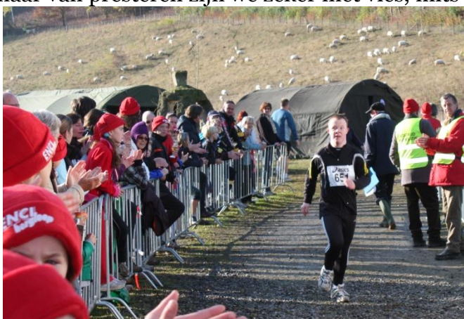
Op naar de finish tijdens de ENCI-Bergloop

Wij bieden verstandelijk beperkte (VB) sporters een gevarieerd atletiekprogramma, dat in de zomer op de atletiekbaan plaatsvindt en in de winter in de sporthal. Daarnaast doen wij regelmatig mee aan wedstrijden die openstaan voor verstandelijk beperkte atleten. We vormen een groep van 20 atleten die elk op eigen niveau meedoen. Gezelligheid staat voorop, maar van presteren zijn we zeker niet vies, mits dat past bij de persoon en diens handicap. De jongste atleet is 18 en de oudste is 60. De groep wordt begeleid en getraind door een enthousiaste groep vrijwilligers, die veel ervaring heeft in het omgaan met atleten met een verstandelijke handicap. In trainingen ligt de nadruk op de sprint, lange afstand (voor een enkeling), kogelstoten en verspringen.