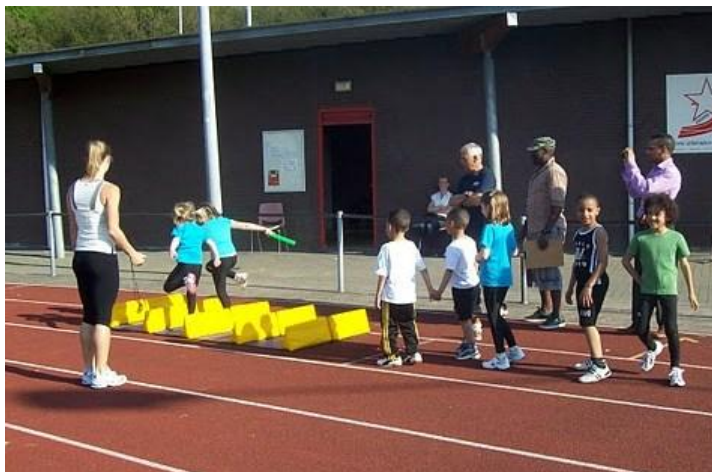
Fun in athletics voor de jeugd