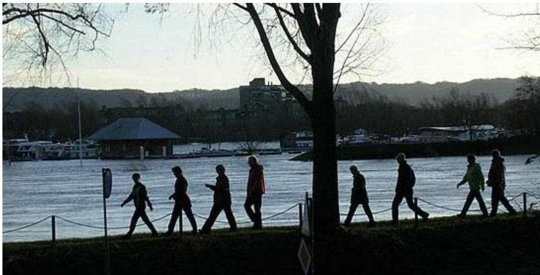
Wandelen met hoog water

Atletiek Maastricht biedt twee soorten wandeltraining aan: Sportief wandelen en Nordic walking. Het verschil zit hem vooral in de stokken die bij Nordic walking worden gebruikt. Door die stokken wordt het bovenlichaam intensiever gebruikt en dus meer getraind. De wandeltrainingen bestaan uit duurlopen en intervaltrainingen. Atletiek Maastricht heeft vijf gediplomeerde wandeltrainers. Elke laatste zondag van de maand wordt er een gezellige wandeling voor wandelenden en aanhang georganiseerd van 15-20 km in het (Nederlands en Belgisch) Limburgse heuvelland.